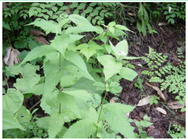
ヨツバヒヨドリ (左) とヒヨドリバナ (右)