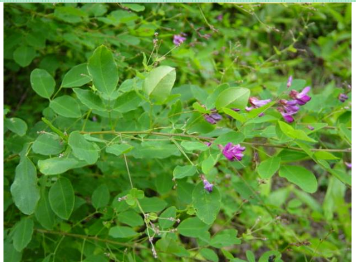
エゾヤマハギ (秋の花です)