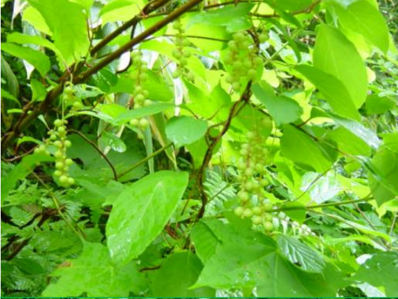
チョウセンゴミシの実 (まだ若い)