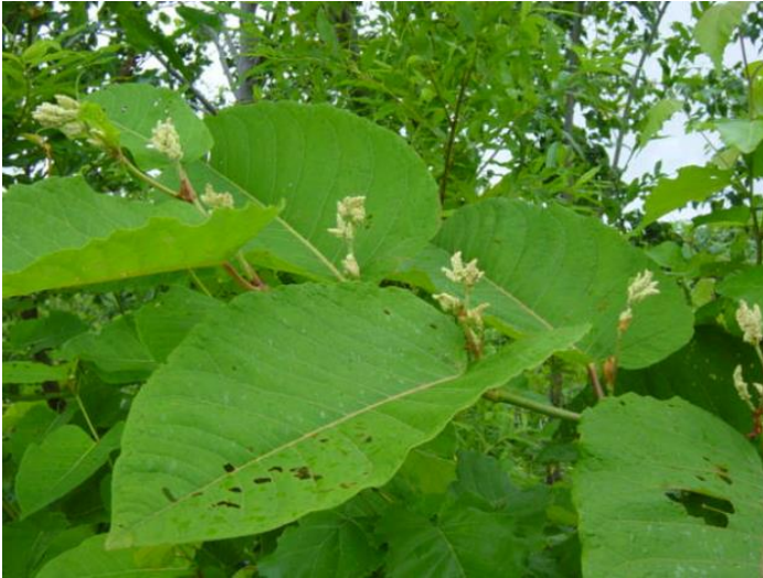
オオイタドリ (雄花は上に花が咲き、雌花は下に花が咲きます。これは雄花です)