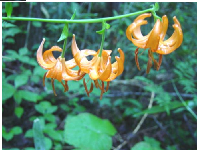
そろそろ終わりです