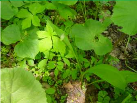
ギョウジャニンニクのつぼみ