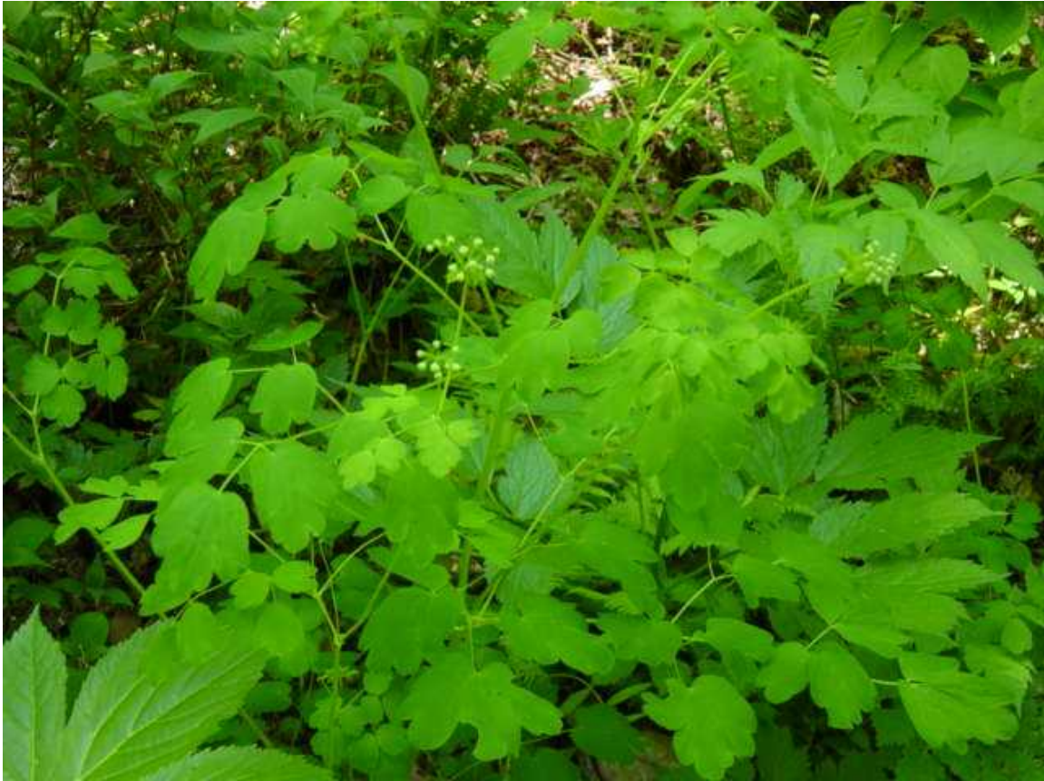
まだつぼみでした