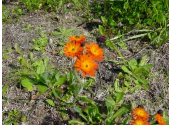
コウリントンポポ