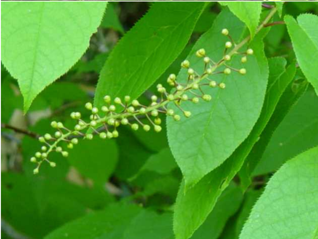
まだつぼみでした