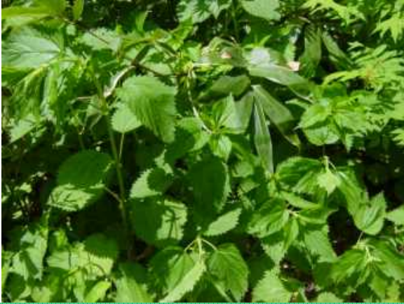
エゾイラクサ（触ると痛い）