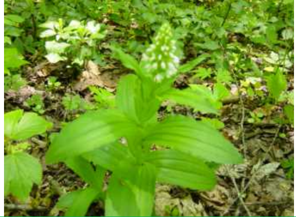
白いノビネチドリ