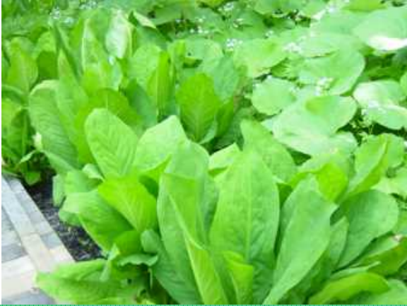
ミズバショウの葉