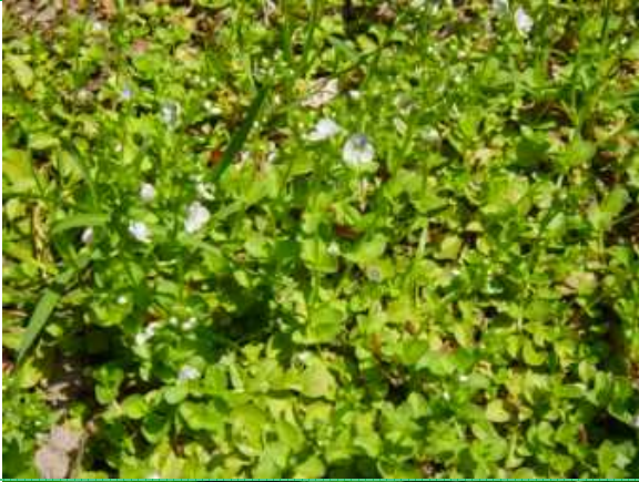
コテングクワガタ