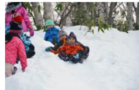
なかよしキャンプ④