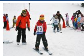
はじめてのスキーキャンプ

市内小学校の先生を対象に実施している事前研修会も5回目となり、冬の宿泊学習に向け、各学校で実施予定であるスノーシューや歩くスキー等の冬季プログラムを体験していただきました。